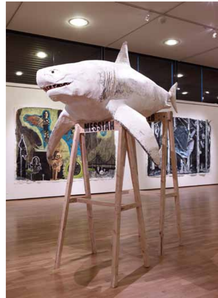
Leper Messiah, 2005

Der 1972 in Lille (F) geborene und heute in Berlin lebende Damien Deroubaix gilt in Frankreich als einer der aufsehenerregendsten Künstler seiner Generation. Sein Schaffen war in den vergangenen Jahren in zahlreichen Einzel- und Gruppenausstellungen zu sehen, so u. a. 2003 im Musée d'art moderne et contemporain Strasbourg, 2007 im Casino Luxembourg, Forum d'art contemporain oder im gleichen Jahr an der Thessaloniki Biennale of Contemporary Art. Die Nacht lautet der Titel seiner ersten umfassenden Präsentation im deutschsprachigen Raum und wurde in Kooperation mit dem Saarländmuseum in Saarbrücken und der Villa Merkel in Esslingen für das Kunstmuseum St.Gallen erarbeitet.