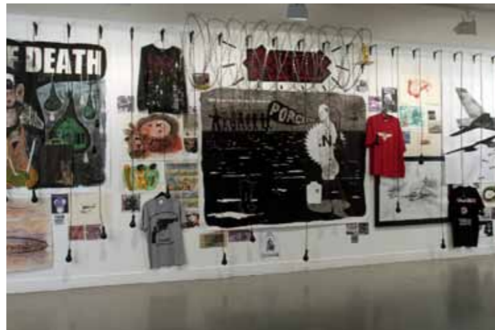
Blick in die Ausstellung im FRAC Basse-Normandie, 2005