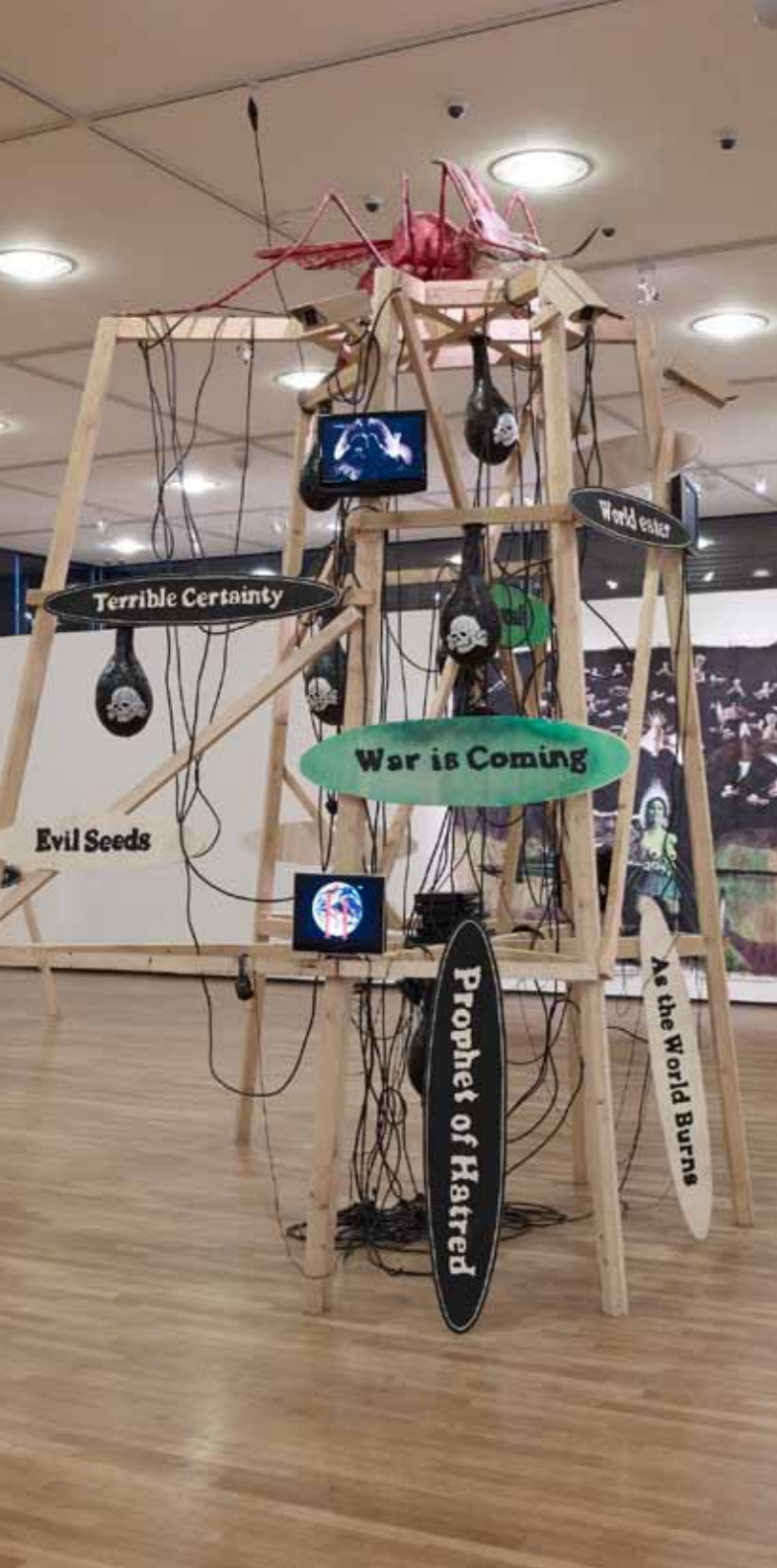
Blick in die Ausstellung im Saarländmuseum, Saarbrücken, 2009