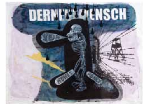
Der neue Mensch, 2007