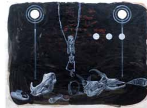
For Victory, 2006, Saarländmuseum, Saarbrücken