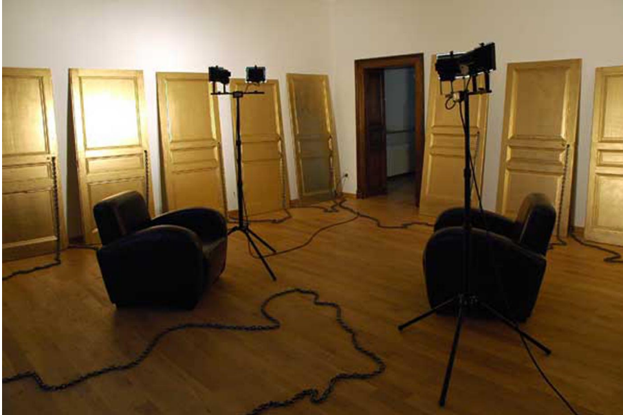
Scentens apprentice Exhibition View Nosbaum Reding, Luxembourg, 2006