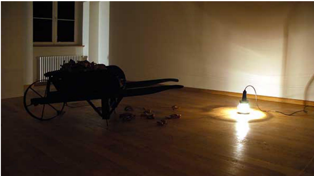
Scentens apprentice Exhibition View Nosbaum Reding, Luxembourg, 2006