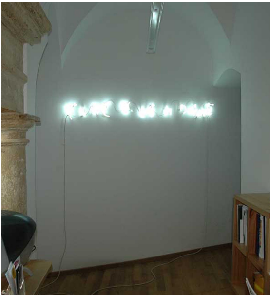
Scentens apprentice Exhibition View Nosbaum Reding, Luxembourg, 2006